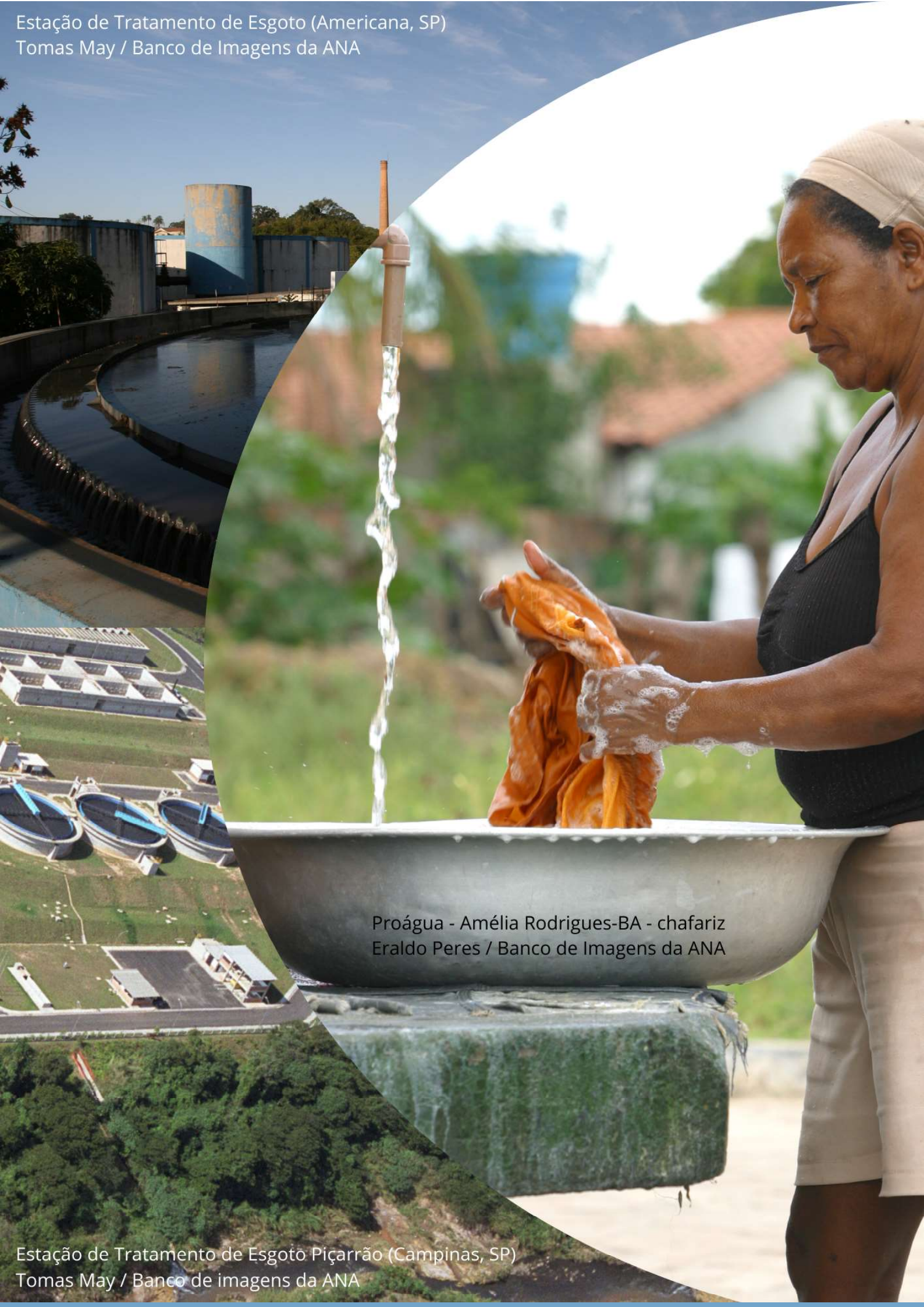
Proágua - Amélia Rodrigues-BA - chafariz