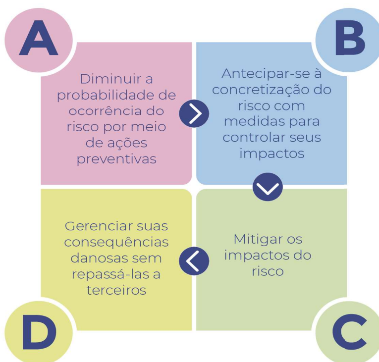
Figura 4: Diretrizes para a alocação de riscos.

O art. 6º, inciso I, da NR 5/2024 contém diretrizes de alocação de riscos baseadas na literatura especializada. Os riscos devem ser alocados à parte que tem melhores condições de: