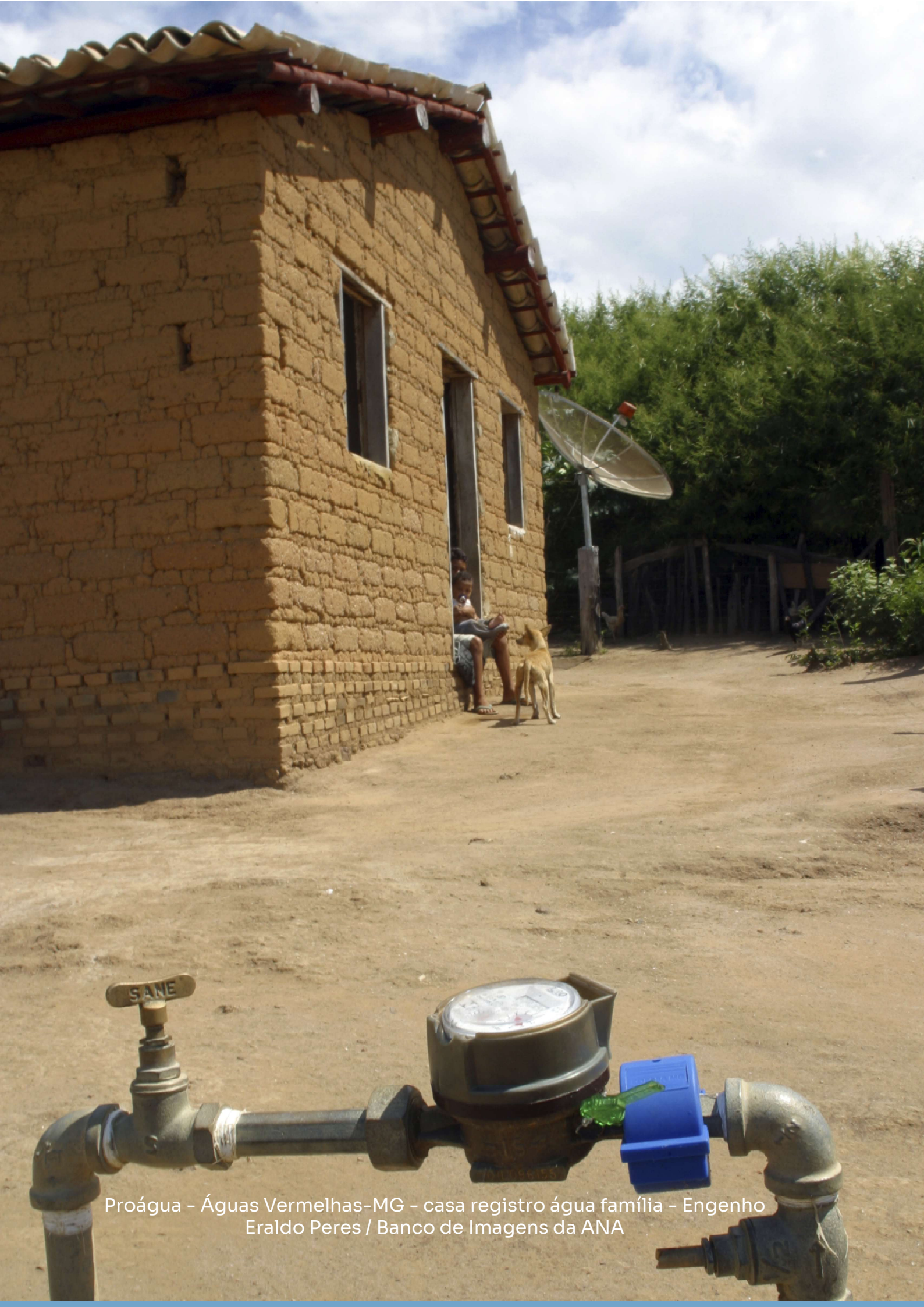
Proágua - Águas Vermelhas-MG - casa registro água família - Engenho Eraldo Peres / Banco de Imagens da ANA