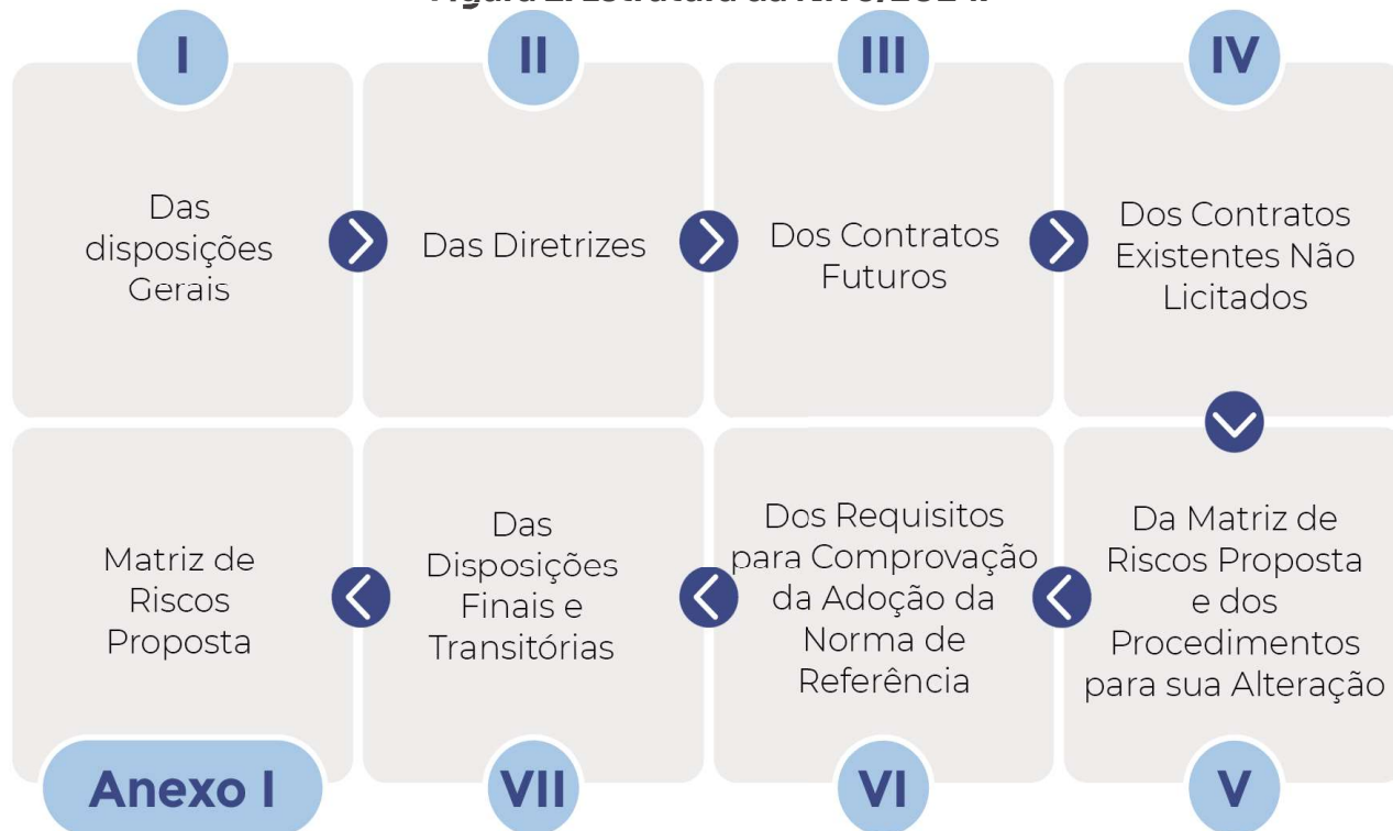
Figura 2: Estrutura da NR 5/2024.

A NR 5/2024 é dividida em 7 (sete) capítulos e é acompanhada por um anexo, que contém uma matriz de riscos proposta, conforme a Figura 2.