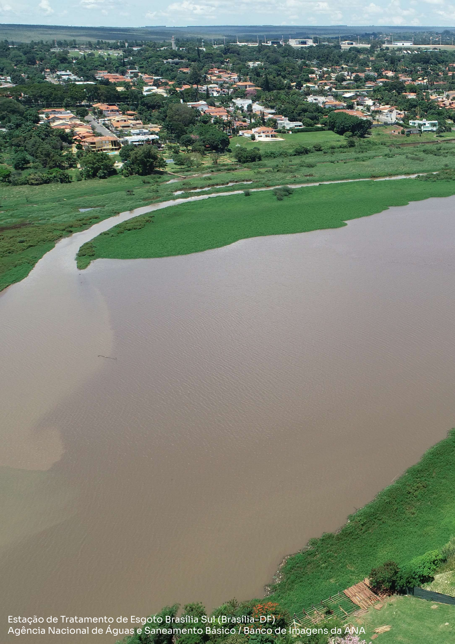
Estação de Tratamento de Esgoto Brasília Sul (Brasília-DF)